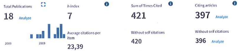
Sum of Times Cited per Year